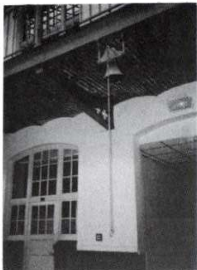
Elle a sonné jusqu'en 1937 heures de cours et de récréation. On l'a réveillée pour le Centenaire.