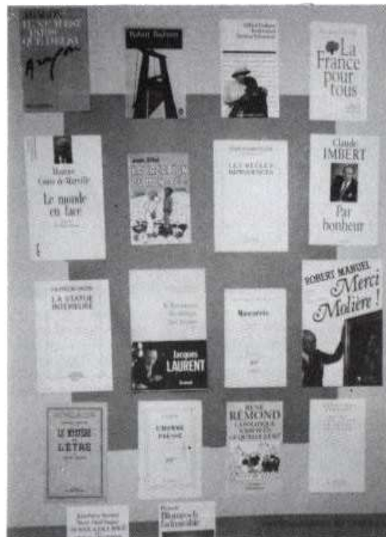
Ouvrages d'Aragon, Robert Badinter, Gilbert Cesbron, Jacques Chirac, Maurice Couve de Murville, Jean Effel, Jean Hamburger, Claude Imbert, François Jacob, Jacques Laurent, Pleyre de Mandiargues, Robert Manuel, Gabriel Marcel, Paul Morand, René Rémond, Jean-Pierre Vernant, Pierre Vidal-Naquet, Louis Pauwels, grands anciens et bons auteurs.

COTISATION ANNUELLE : 125 FRANCS ETUDIANTS : 50 FRANCS ELEVES : 30 FRANCS chèques à l'ordre de l'association