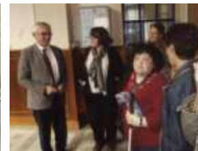
Accueil au Lycée